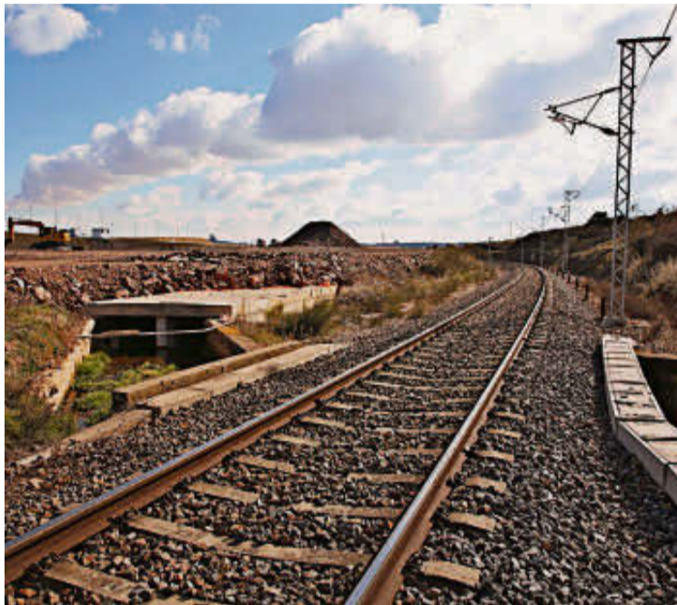
Obras del Puerto Seco junto a la vía férrea Salamanca-Fuentes de Oñoro.

Se le unen otros 1,2 millones de euros para ejecutar las actuaciones de rehabilitación y regeneración urbana que están pendientes en Salamanca. Se trata de los conocidos como Bloques de Nícar; el proyecto de los bloques de la calle Los Gladiolos, en el barrio de Garrido; además de la segunda fase de la Chinchibarra, después de que la primera culminara con gran aceptación por parte de los vecinos.