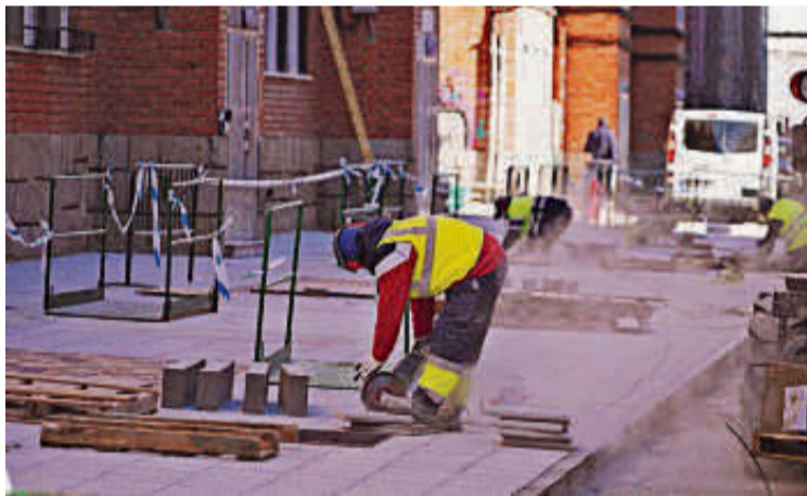
Trabajos de la primera fase de rehabilitación de la Chinchibarra.